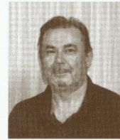
国立パリオペラ座バレエ団 メートルド・バレエ