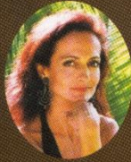
ジュリエットの母