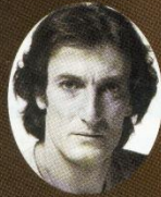
ジュリエットの父