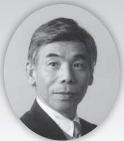
京都バレエ専門学校 主任教授 元(公社)日本バレエ協会 理事 ミタカバレエアカデミーディレクター